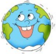
La terre tourne.