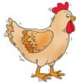
La poule caquette.