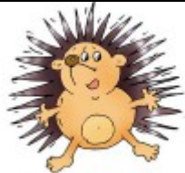
Un hérisson pique.