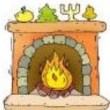
Le feu brûle.