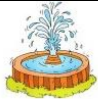
La fontaine gicle.