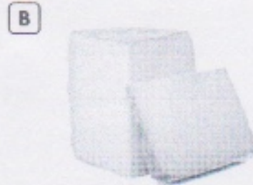
Fromage Salers fabriqué dans le Cantal.