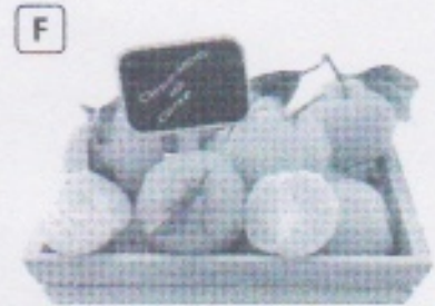
Clémentines produites en Corse.