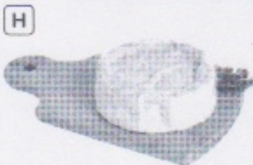
Camembert, spécialité de l'Orne, en Normandie.