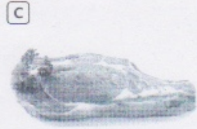
Viande de bœuf en vente directe dans une ferme des Deux-Sèvres.