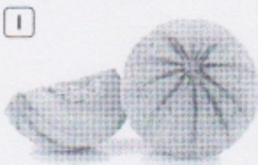
Melon des Charentes.