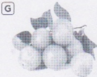
Mirabelles d'Alsace, dans le Bas-Rhin.