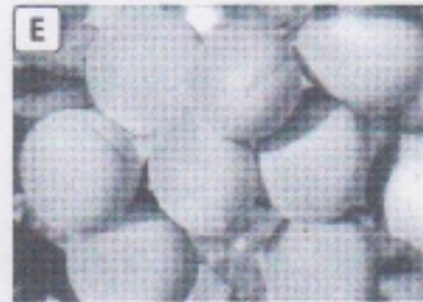
Abricots du Roussillon cultivés dans les Pyrénées-Orientales.