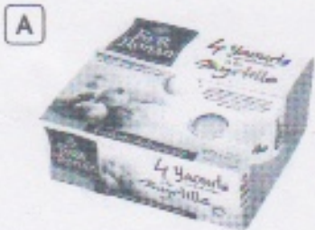
Yaourt fabriqué dans une laiterie artisanale à Rohan dans le Morbihan.

1 Repère sur la carte de France l'endroit où sont produits ces aliments. Écris la lettre correspondante en rouge.