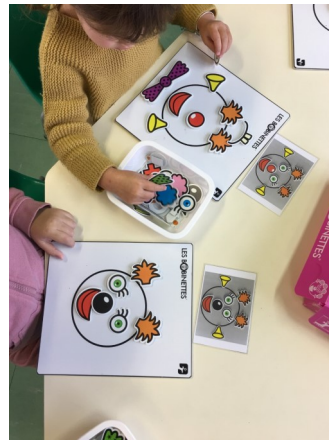
Jeu d'attention et d'observation, langage oral