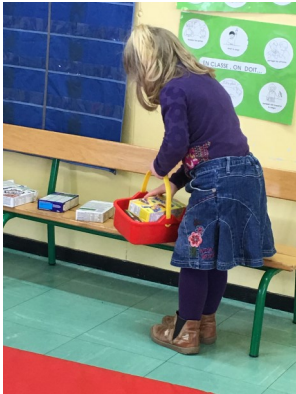
Jeu de la marchande avec les petits et les moyens

Nous continuons également à étudier deux albums sous différentes formes : Les trois petits cochons pour les petits et Le bonhomme en pain d'épice pour les moyens.