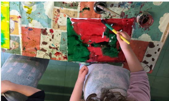
Art plastique et géométrie pour les moyens : préparation du fond pour les formes géométriques à reconstituer