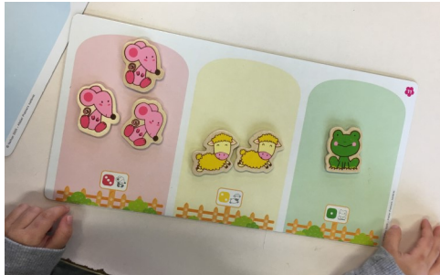
Dénombrement avec les petits