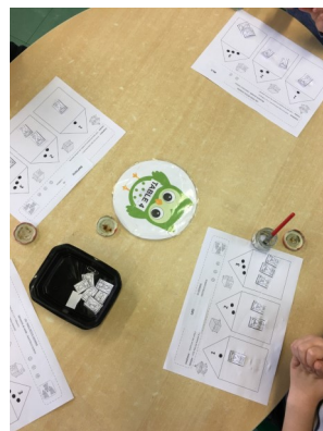
Autour de l'album des Trois petits cochons