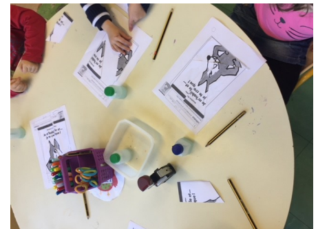
Autour de l'album : Je m'habille et je te croque