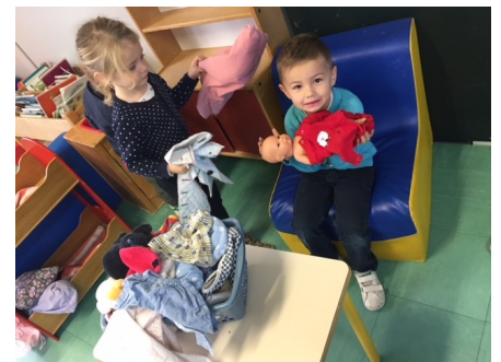
Le coin bébé