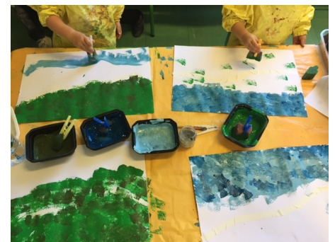
Art plastique : on utilise de nouvelles techniques