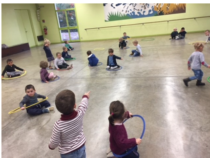
Activité musicale et sportive.