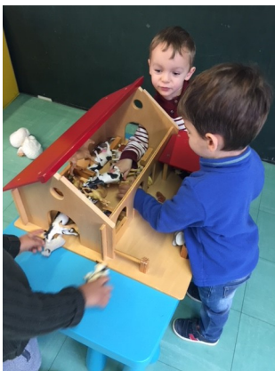
Le coin « animaux de la ferme »