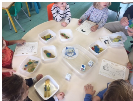
Travail sur les vêtements et l'habillement