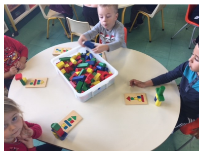
Construction géométriques et représentations spatiales