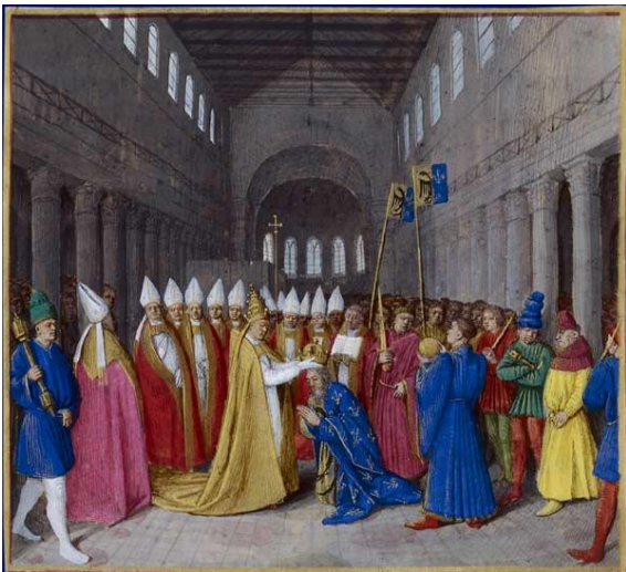
Le sacre de Charlemagne (manuscrit du XV ème siècle)

Charlemagne aide plusieurs fois le pape contre ses ennemis, resserrant ainsi les liens entre l'Eglise et la royauté. En l'an 800, le jour de Noël, il est couronné empereur par le pape à Rome.