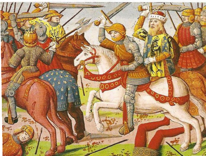
Miniature d'un manuscrit du xv ème siècle