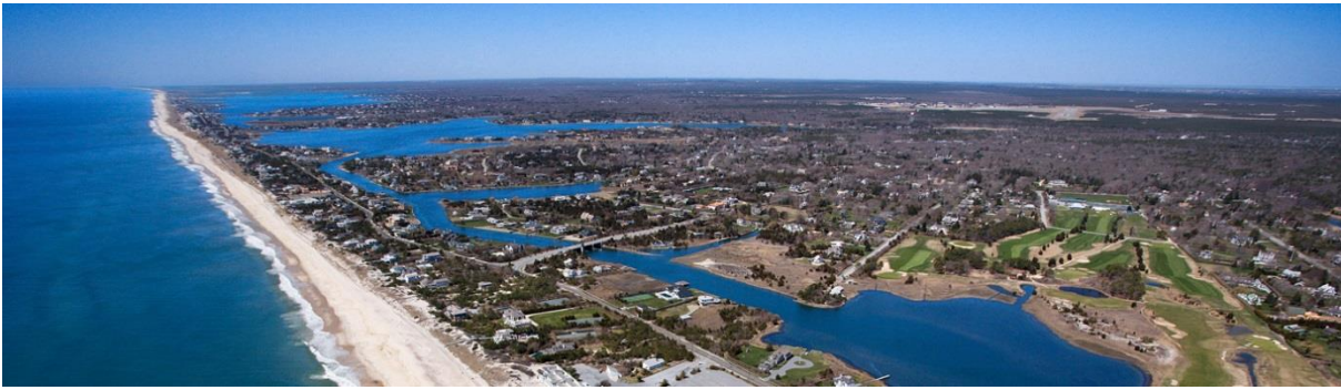
Long Island, Etat de New York, USA