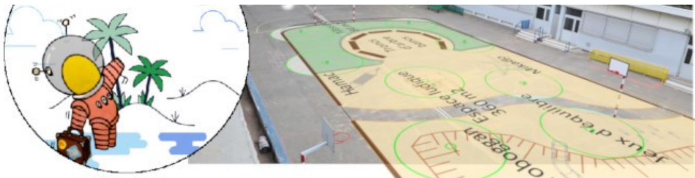
Projection du plan Oasis sur la cour actuelle