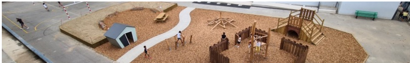
Notre Oasis est arrivée cet été ! Les plantations arriveront en décembre.