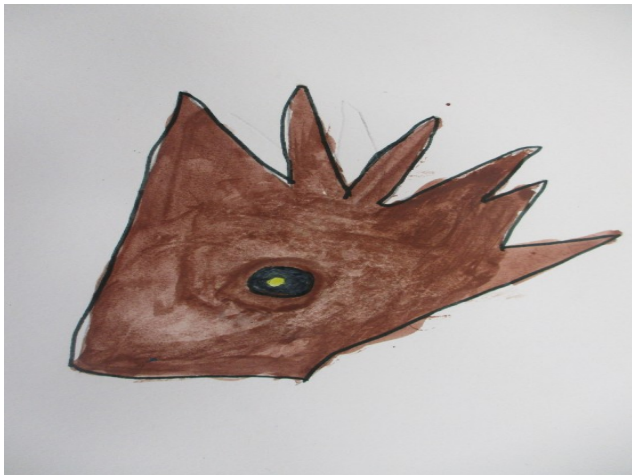
Ce dessin représente son aile et le petit rond noir et jaune, c'est sa blessure. Nous ne savons pas ce qui a causé cette blessure à l'animal.