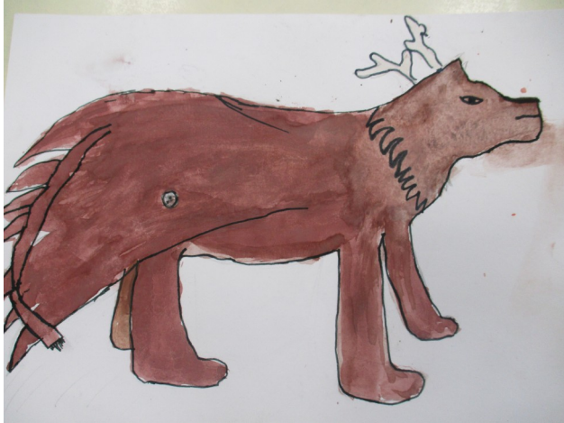
Cet animal est gentil mais très peureux. Il mesure 1,30 m environ.