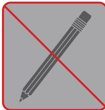
Crayons de bois