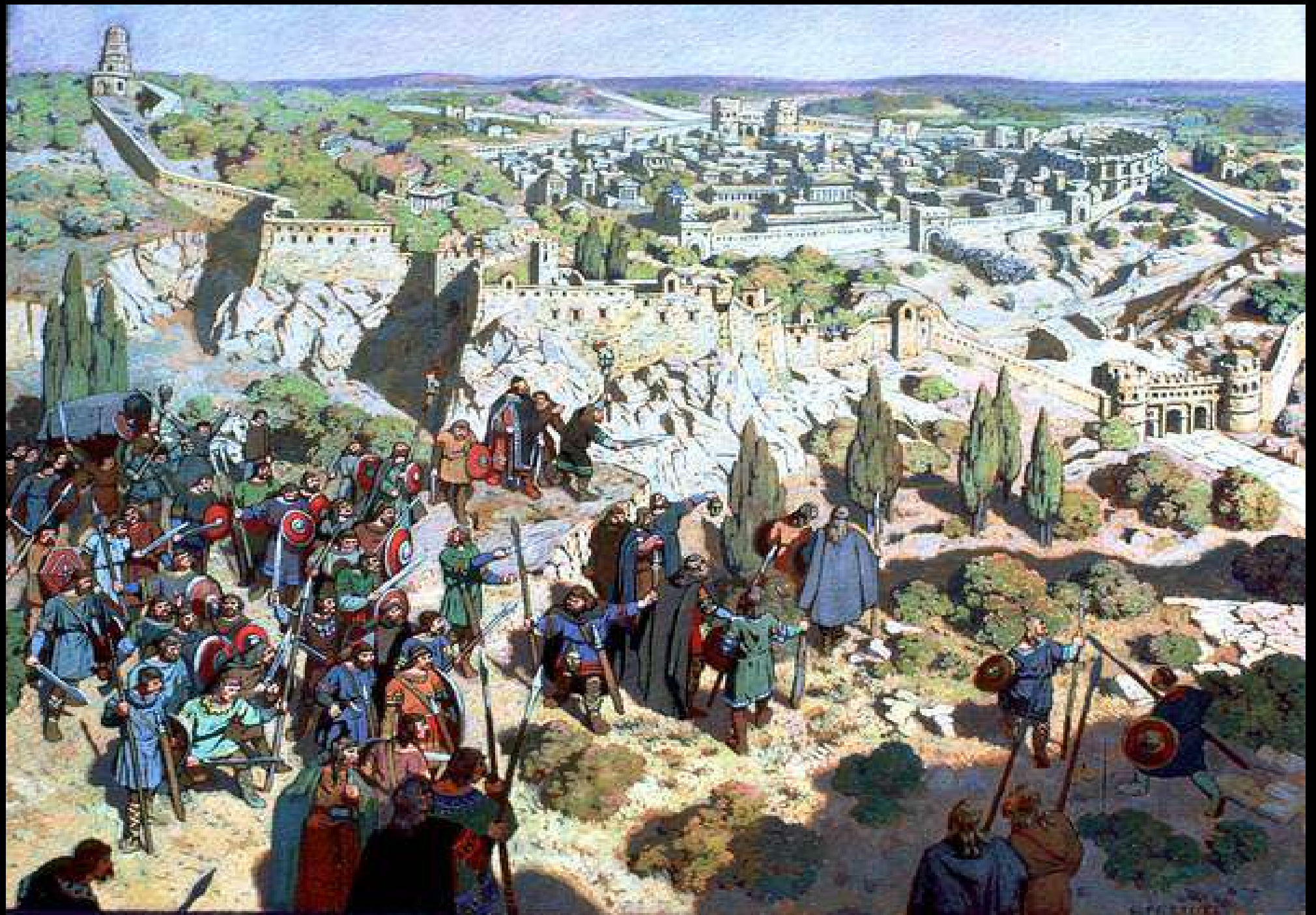
La prise de Nîmes par les Vandales en 407