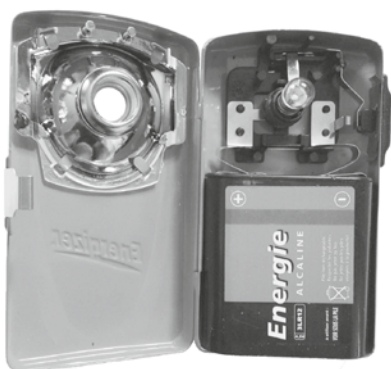
Lampe de poche