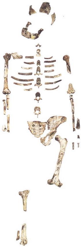
Doc.1. Squelette de Lucy, vieux de 3,2 millions d'années, découvert en Ethiopie.

Les ancêtres des hommes sont apparus sur le continent africain il y a environ 6 millions d'années. Ces pré-humains sont appelés « australopithèques ». Les archéologues ont trouvé des traces de leur existence. En Ethiopie, ils ont découvert le squelette d'une femme qu'ils ont baptisée « Lucy ».