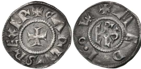
Charlemagne : denier.

En 781, Charlemagne créé une nouvelle monnaie frappée en argent, la livre . 1 livre = 240 deniers = 20 sous de 12 deniers