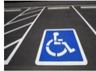
place de parking aménagée