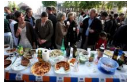
Fête des voisins