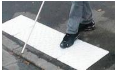
sol en relief signalant route

Mieux vivre c'est aussi vivre ensemble. Il faut faciliter le quotidien de tous et notamment des personnes handicapées en proposant des aménagements (trottoirs abaissés, feux tricolores sonorisés, rampes d'accès...).