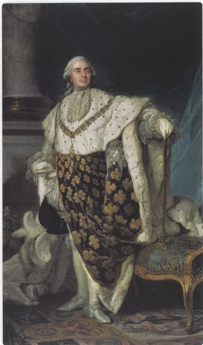
Louis XVI en costume de sacre • Joseph-Siffred Duplessis • vers 1775

Le sacre de Louis XVI a lieu dans la cathédrale de Reims le 11 juin 1775. Dans ce portrait, il est représenté en costume de sacre, dans la même position que Louis XIV. En effet, il règne en roi absolu, selon les mêmes principes que son aïeul.