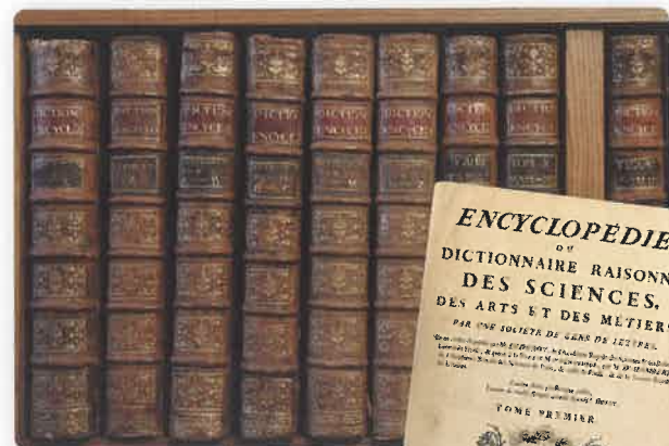
Volumes de l'Encyclopédie

Les idées et les savoirs se diffusent de plus en plus facilement grâce à l'impression de livres et de journaux, aux correspondances (échanges de lettres) et à la fréquentation de lieux de discussion (salons, cafés...). En France, les œuvres de Montesquieu, Voltaire ou encore Rousseau changent peu à peu les mentalités.