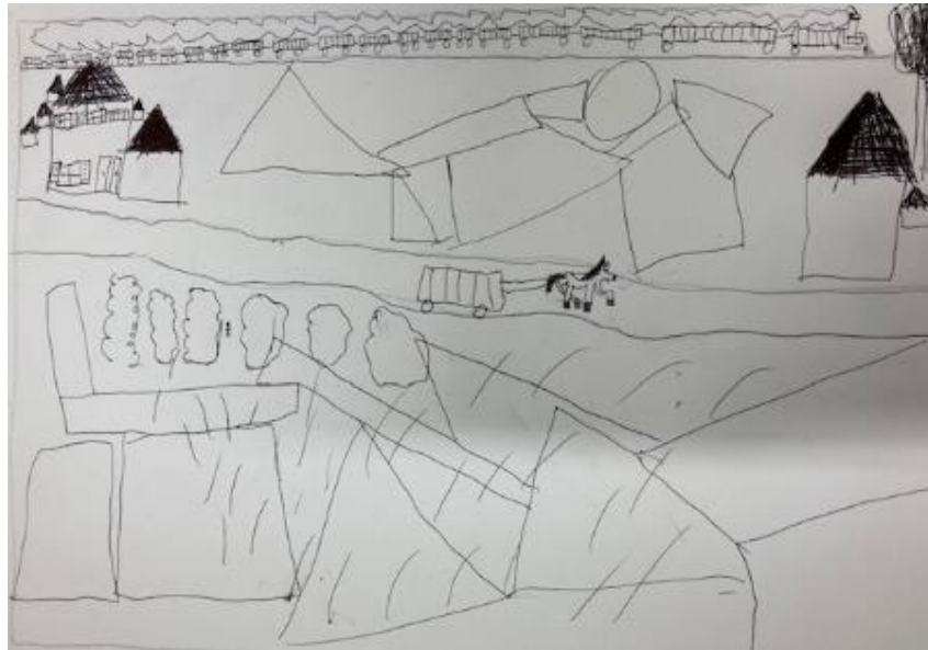
Exemples de productions d'élèves – classe de CE1