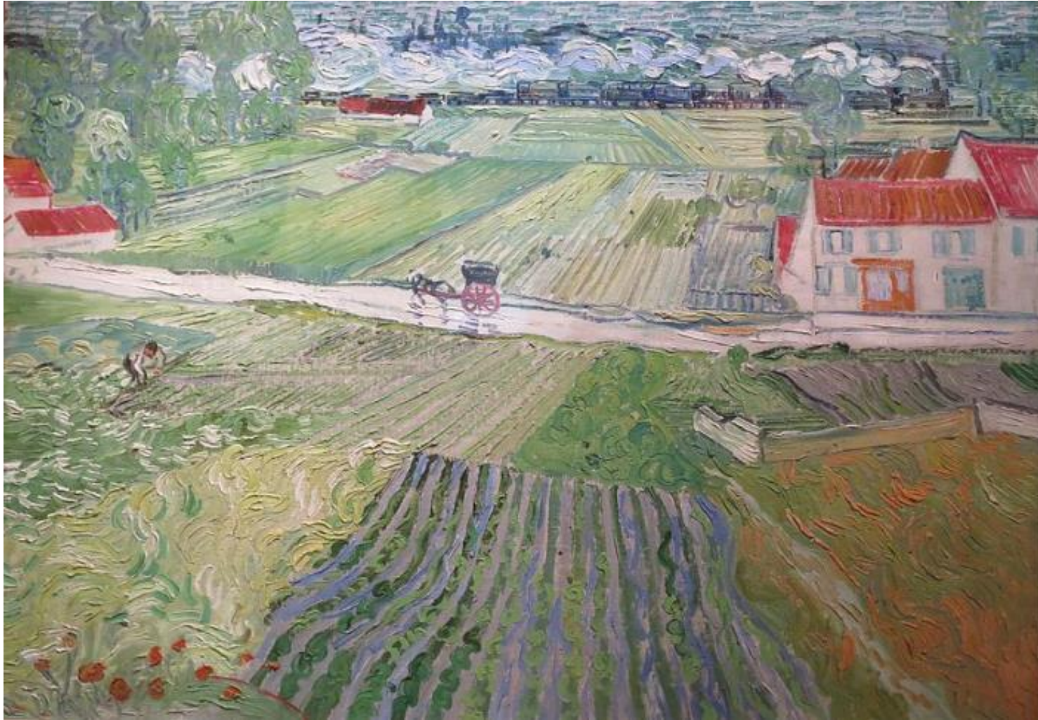
Vincent Van Gogh, Paysage d'Auvers avec charrette et train , huile sur toile, 0.72x0.90m, 1890, musée Pouchkine Moscou RMN https://www.photo.rmn.fr/CS.aspx?VP3=SearchResult&VBID=2CMFCINRS7A1E&SMLS=1&RW=1366&RH=587