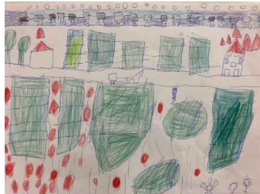
Exemples de productions d'élèves classe de CE1