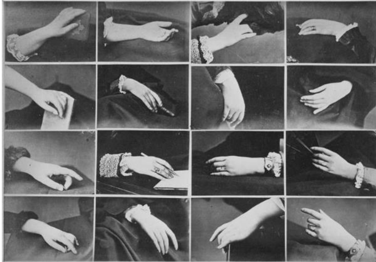
Jean-Louis Igout, Jeux de mains et de pieds, étude pour artiste, 0.194x0.138m, photographie, vers 1875