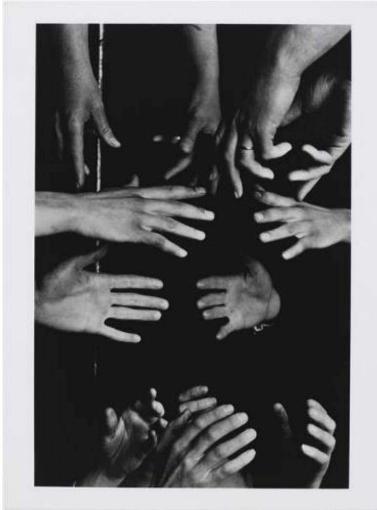
Emmanuel Sougez, Jeux de mains, 1929