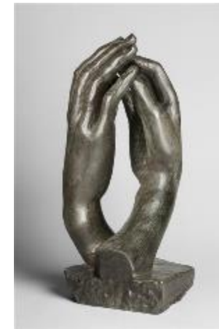
Auguste Rodin, La cathédrale , sculpture bronze, 0.622x0.273 x0.298 m, conçue en 1908, fondue en 1925