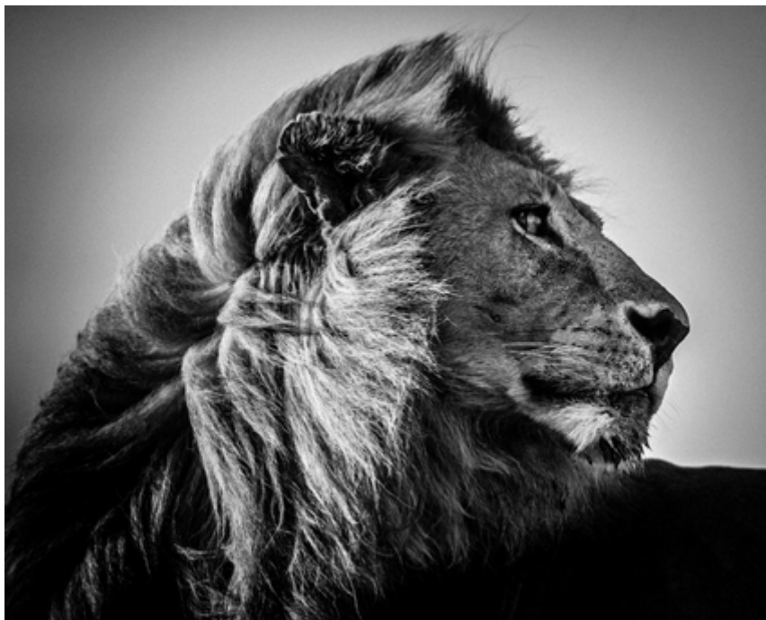
Lion in the wind 3, Laurent Baheux, © Yellowkornor