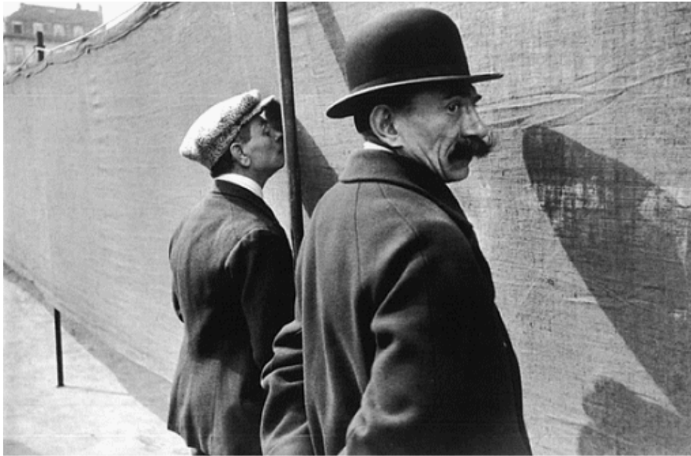
Brussels, Belgium, H. Cartier-Bresson, 1932, © Eric Franck fine Art