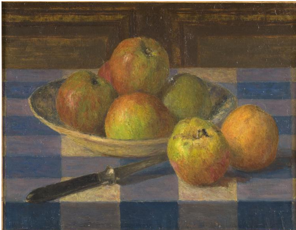
François Hamon, peinture, début XXème siècle, Musée des Beaux-arts Rennes