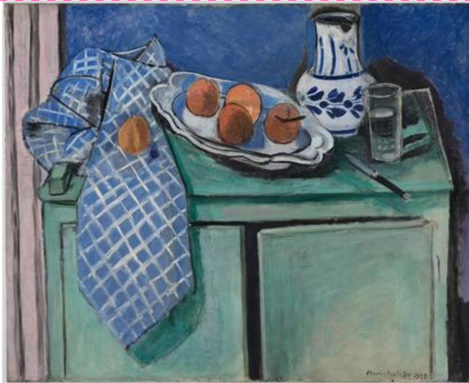
Henri Matisse, Nature morte au buffet vert, Hauteur : 0.815 m Largeur : 1 m, huile sur toile, 1928, Paris Centre Pompidou, RMN