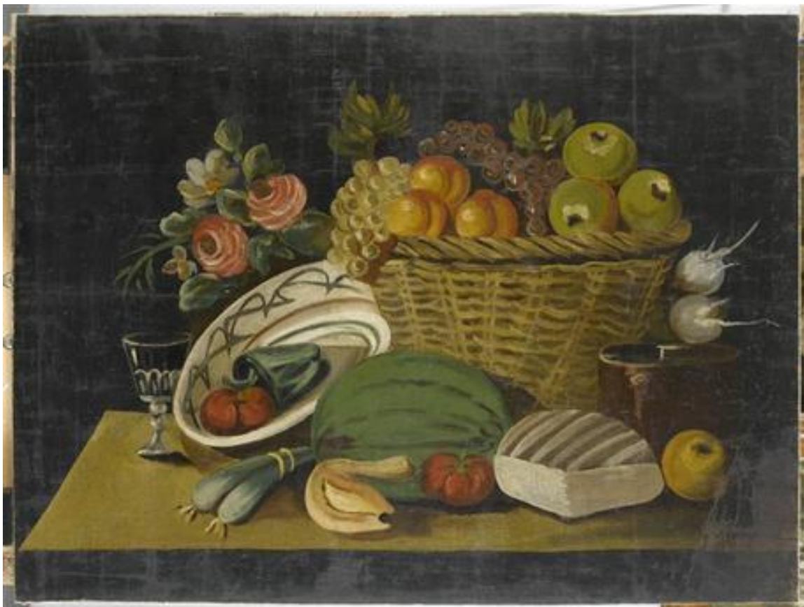
Nature morte, peinture, 0.59 x 0.805m, Marseille MuCEM

Aujourd'hui, je te propose de réaliser une photographie. D'abord, je vais te montrer quelques peintures d'artistes.