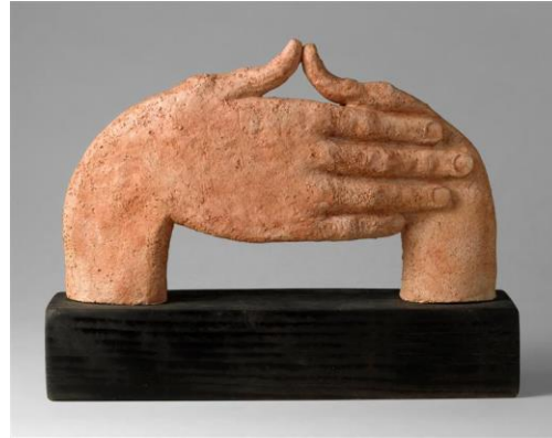
Yves Mohy, Mains , 2003, sculpture