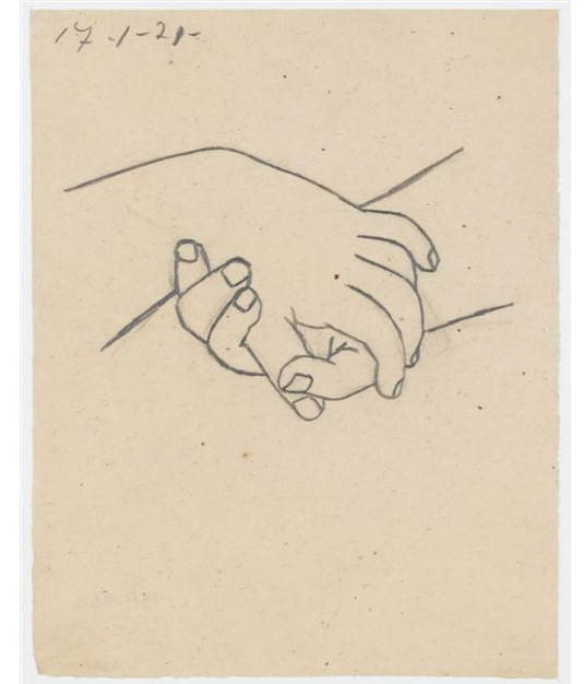
Pablo Picasso, Deux mains croisées , dessin, 1921