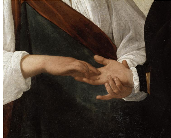
Le Caravage, La diseuse de bonne aventure , détail, environ 1595