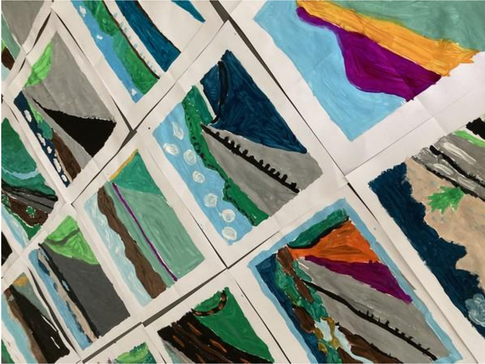
Groupe arts et culture31 Arts plastiques