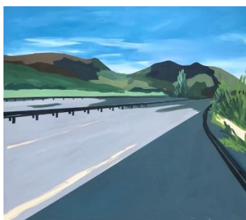
Cassandra Cecchella, A64, sortie 18, 80x90cm Acrylique sur toile, 2020 https://www.cassandrececchella.com/vinci