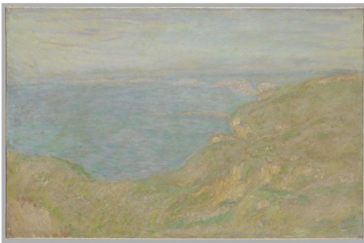
Claude Monet, La falaise de Fécamp, huile sur toile, 0.65 x 1 m, 1897, RMN

Est-ce que tu peux voir le ciel et la mer ? Pourquoi est-ce qu'on ne les distingue pas bien ? Y a-t-il des traits très visibles qui séparent le ciel, la mer et la terre ?