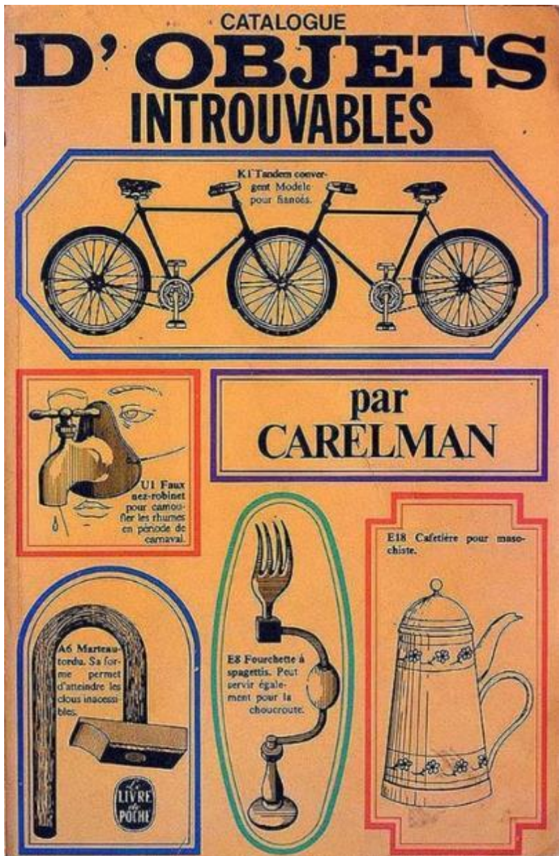
Jacques Carelman, Catalogue d'objets introuvables, Cherche midi collection Beaux livres, 2003