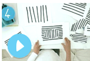
Création : les lignes

Quelques exemples...il y en a beaucoup d'autres.