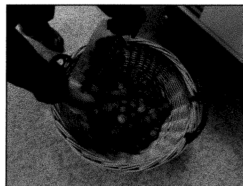
Découvrir une grande quantité de noix. Transporter des noix jusqu'à un panier.