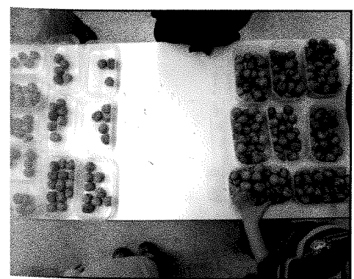
Répartir les boîtes en deux catégories.