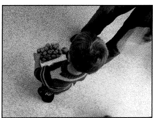
Prendre une boîte qui contient beaucoup ou un peu de noix.