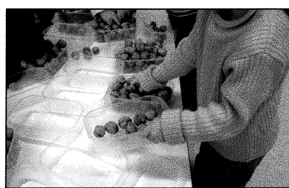
Répartir toutes les noix dans toutes les boîtes avant de les transporter.