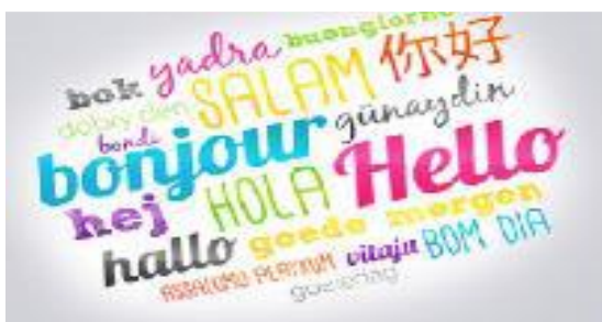
Langues vivantes étrangères 31