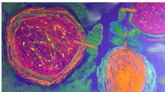
Arts et culture 31