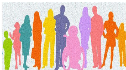
Service départemental école inclusive 31