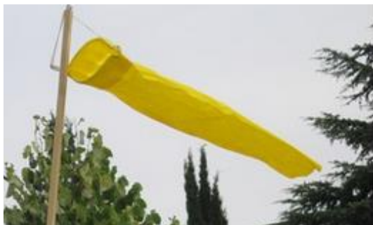
Education au développement