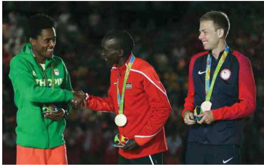
Les trois médaillés du marathon des JO de Rio 2016 se félicitent.

Pierre de Coubertin est persuadé que le sport peut être très bénéfique non seulement pour la santé (physique et mentale), mais aussi pour la vie en communauté. Pour cela, l'Olympisme doit cultiver plusieurs valeurs fondamentales :